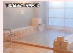
下風呂温泉 海味の湯