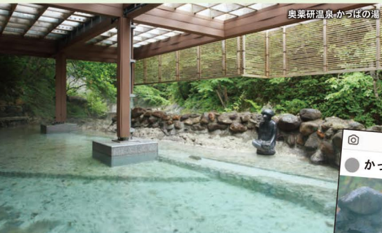
奥薬研温泉かっぱの湯