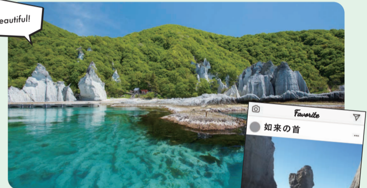
#大自然の迫力ある造形美 仏ヶ浦 A-3 巨岩・奇岩が並び、極楽浄土を思わせる神秘的な景色。国の名勝及び天然記念物。 ◆ 問: NPO法人佐井観光協会 0175-38-4515 ◆ 交通: JR下北駅より徒歩約2時間 / バス停「むつ」より下北交通バス・佐井行きで約2時間、「佐井」下車後徒歩約2分、佐井港より観光船で約30分