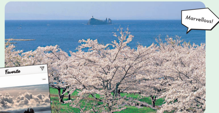
#陸奥湾と鯛島一望 愛宕山公園 A-5 脇野沢港西に位置する小高い丘の上にあり、ここから眺める陸奥湾は絶景。春は桜やツツジが咲き誇る。 ◆ 問: 下北観光案内所 0175-34-9095 ◆ 交通: 脇野沢港より徒歩約10分 / JR大湊駅より徒歩約55分 / JR大湊駅よりバス・下北線約1時間5分、「脇野沢」下車後徒歩約5分