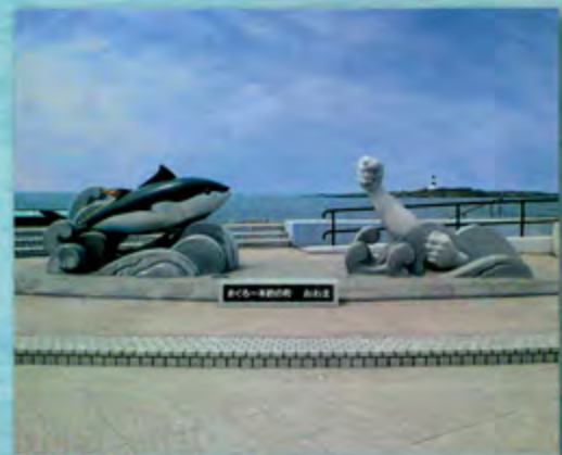
大間崎 (大間町) 本州最北端。津軽海峡をはさみ対岸の函館市汐首岬までは最短でわずか17.5km。晴天時には北海道の山々を間近に見ることができる。