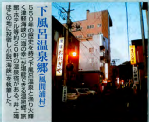
550年の歴史を持つ下風呂温泉と湧り火輝く津軽海峡の「海の幸」が堪能できる温泉地。旅館・ホテル等約20軒の温泉宿がある。井上靖はこの地に投稿し小説「海峡」を執筆した。