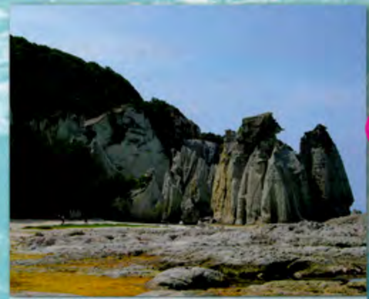
仏ヶ浦 (佐井村) 奇岩・怪石が約2kmに渡って続く下北半島を代表する景勝地。海の蒼さが美しさをより一層引き立てる。佐井港、牛滝港、脇野沢港からは遊覧船も運航している。