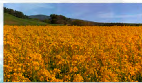
大豆田地区菜の花畑 (横浜町) 日本最大級の栽培面積を誇る横浜町のシンボル。例年5月中～下旬には町内大豆田地区を中心に、あたり一面黄色に染められる。開花期にあわせ「菜の花フェスティバル in よこはま」のイベントも開催。マラソン大会、大迷路、特産品即売などのイベントも開催される。