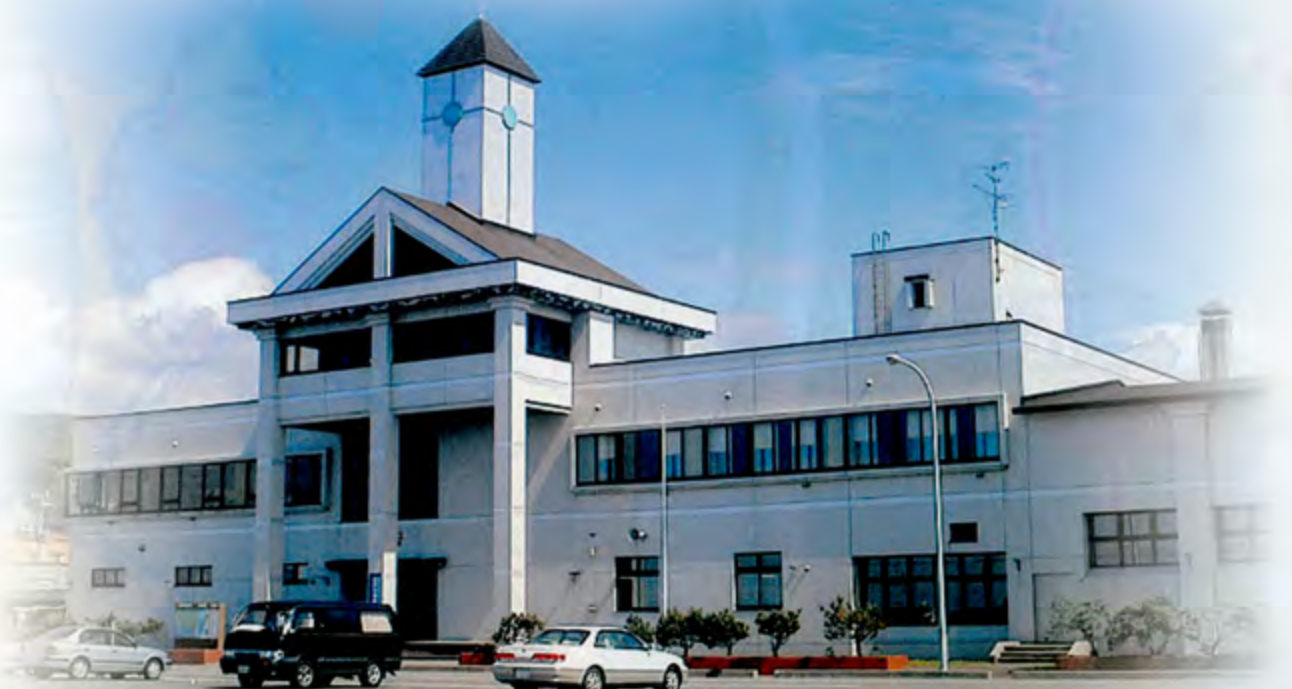
このパンフレットは仏ヶ浦環境保全推進協力金で作られています。