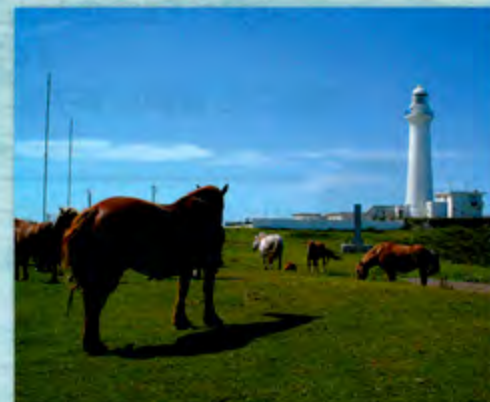
尻屋崎灯台 (東通村) 本州最北端に位置し、その先端には東北最古の洋式灯台が立つ。周辺は寒立馬が草を食む草原が広がる。