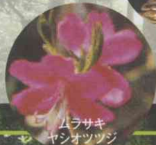
ムラサキヤシオツツジ