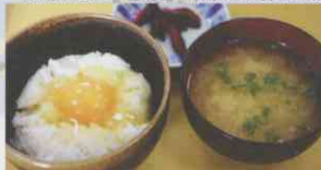
蓬田産の卵を使った人気の「卵かけご飯」