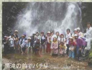
黒滝の前でパチリ

ところで、山にはふたつの滝があります。ひとつは大倉岳にある「大倉大滝」、もうひとつは袴腰岳にある「黒滝」です。黒滝は高さ11mの雄大な滝で、その迫力はまさに絶景。ぜひ一度ご覧になってください。