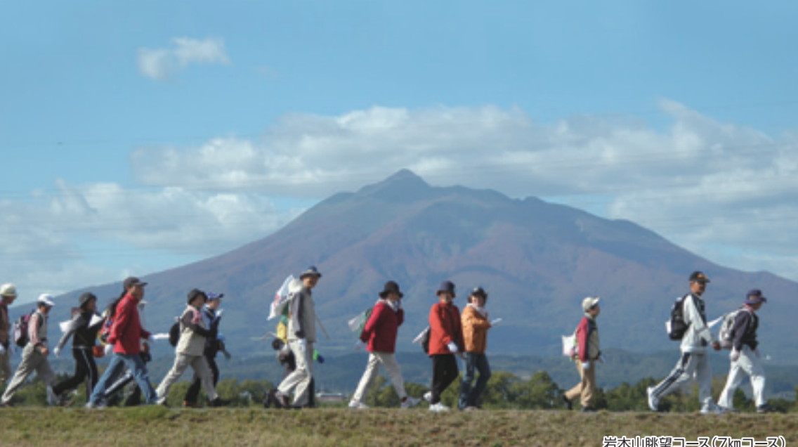
岩木山眺望コース(7kmコース)