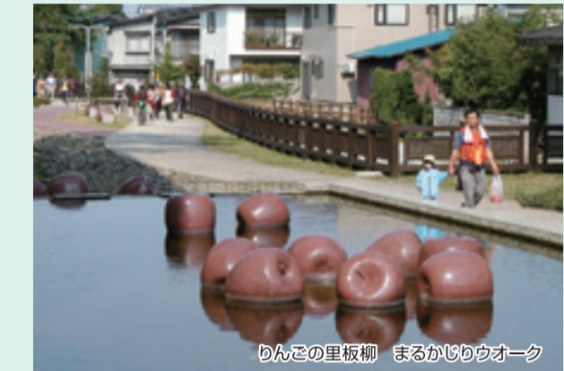
りんごの里板柳 まるかじりウォーク