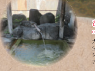
高増温泉 不動乃湯 map:E-3③

1人400円、小学生以下無料、家族風呂あり。昭和30年の創業から老若男女問わず多くの方に親しまれています。