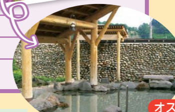
大鰐町地域交流センター「鰐come」