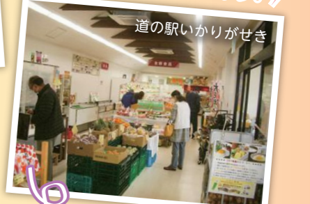
道の駅いかりがせき