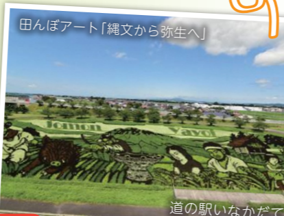
道の駅いなかだて