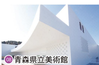
08 青森県立美術館 Aomori Museum of Art / 아오모리현 미술관 / 青森县立美术馆 / 青森縣立美術館