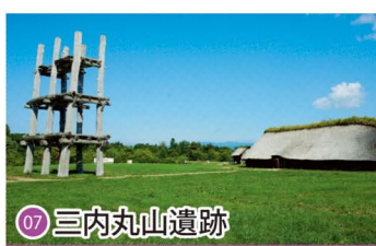
07 三内丸山遺跡 Sannai-Maruyama Site / 산나이마루야마 유적 / 三内丸山遗址 / 三内丸山遗址