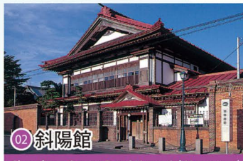
02 斜陽館 Shayokan - Osamu Dazai Memorial Museum / 사요칸 / 斜阳馆 / 斜陽館