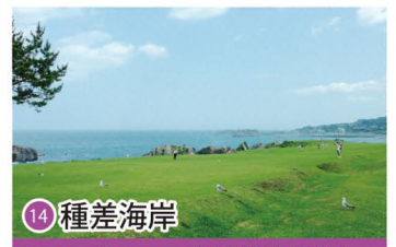
14 種差海岸 Tanesashi Coast / 다네사시 해안 / 种差海岸 / 種差海岸