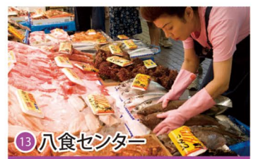
13 八食センター Hasshoku Center / 핫쇼쿠 센터 / 八食中心 / 八食中心