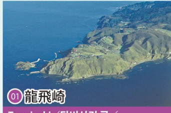
01 龍飛崎 Tappizaki / 닷비사키 곶 / 龙飞崎 / 龍飛崎