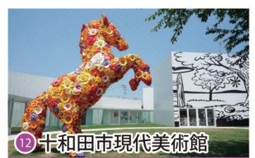
12 十和田市現代美術館 Towada Art Center / 도와다시 현대미술관 / 十和田市现代美术馆 / 十和田市现代美术馆