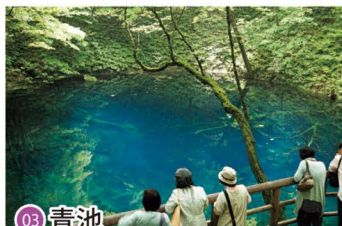
03 青池 Aoike / 아오이케 호수 / 青池 / 青池