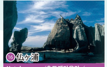
16 仏ヶ浦 Hotokegaura / 호토케가우라 / 佛之浦 / 佛之浦