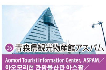
06 青森県観光物産館アスパム Aomori Tourist Information Center, ASPAM / 아오모리현 관광물산관 아스팜 / 青森县观光物产馆ASPAM / 青森縣觀光物產館ASPAM