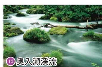
10 奥入瀬溪流 Oirase Keiryu / 오이라세 계류 / 奥入瀬溪流 / 奥入瀬溪流