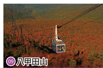
09 八甲田山 Hakkoda Mountains / 핫코다산 / 八甲田山 / 八甲田山