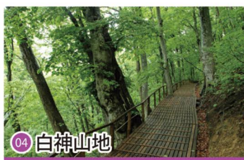
04 白神山地 Shirakami-Sanchi / 시라가미산지 / 白神山地 / 白神山地