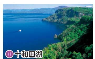
11 十和田湖 Lake Towada / 도와다코 호수 / 十和田湖 / 十和田湖