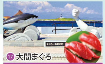
17 大間まぐろ Oma Tuna / 오오마 참치 / 大间金枪鱼 / 大間鮪魚