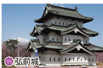
05 弘前城 Hirosaki Castle / 히로사키성 / 弘前城 / 弘前城