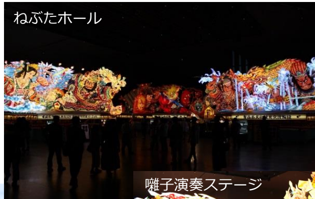
囃子演奏ステージ