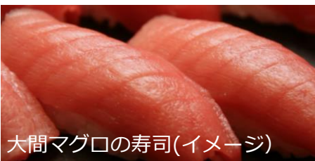
大間マグロの寿司(イメージ)