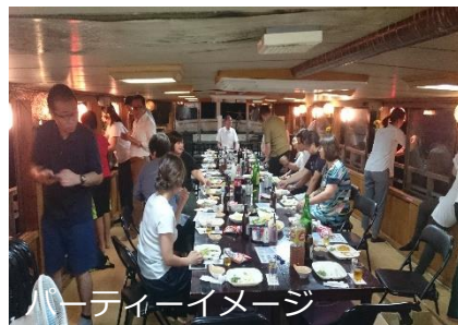
パーティーイメージ