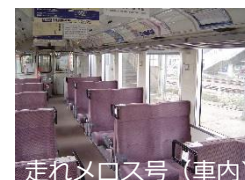
走れメロス号（車内）