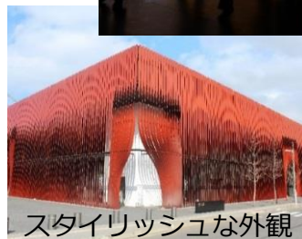
スタイリッシュな外観