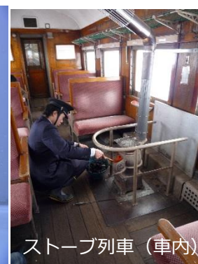
ストーブ列車（車内）