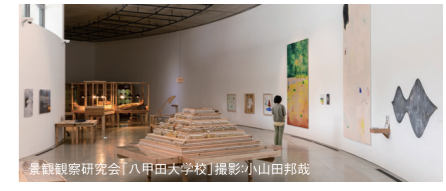
展覧会観覧研究会「八甲田中学校」撮影:小山田邦哉