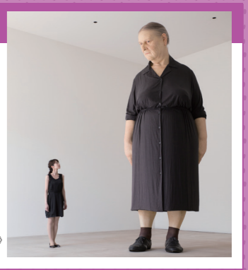
ロコモエイク(スタンディングウーマン)